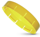
GPN 655 Form A