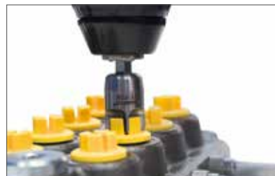
Momento de apriete Nm