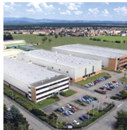
France : Plastiques Pöppelmann France S.A.S., Rixheim