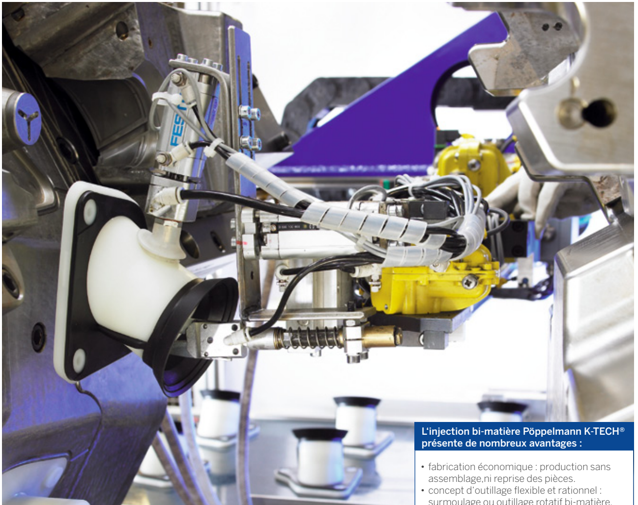
Boîtier pour véhicule avec éléments d'étanchéité, injecté en bi-matière.