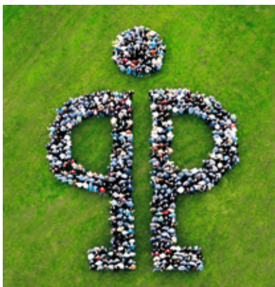
Plus de 1 650 salariés Pöppelmann se portent garant de la productivité, de la qualité et du niveau de service.

La fabrication est certifiée : ISO / TS 16949 : 2009 et DIN EN ISO 9001 : 2008