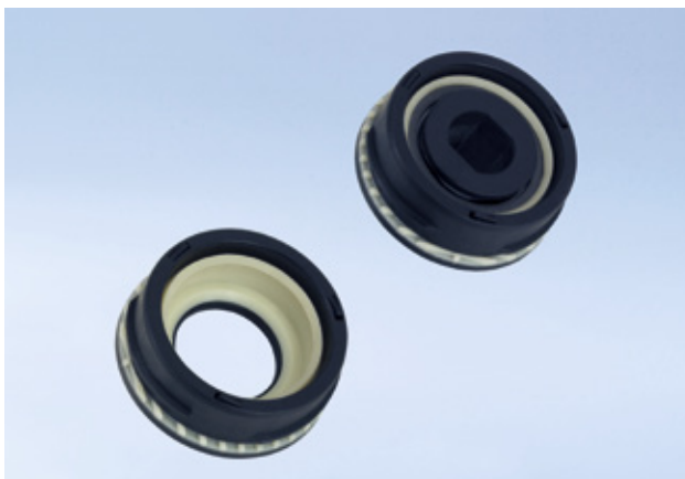
Palier bi-matière servant de support complémentaire à l'arbre de direction, tout à la fois élément anti-bruit et d'étanchéité en protégeant des projections d'eau et de saletés. Le roulement est monté fixe et sans jeu dans le composant souple en matière thermoplastique élastomère. Le composant rigide est encastré définitivement dans le boîtier lors du montage.