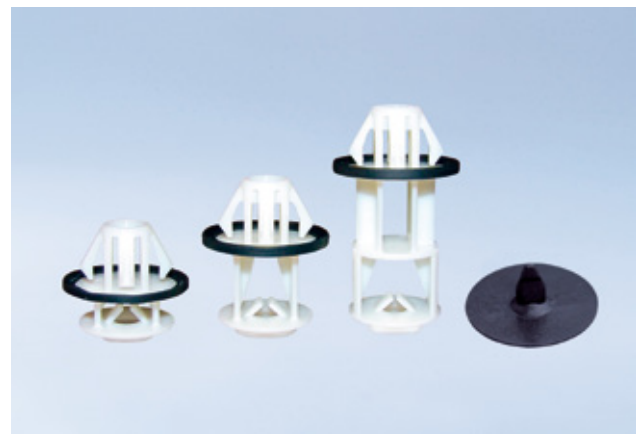
Attache bi-matière pour habillage d'un longeron de carrosserie automobile. L'élément de fixation est réalisé en Polyamide (PA), le joint d'étanchéité est surmoulé dans une matière type styrol-ethenbuten-styrol (SEBS), afin d'assurer une étanchéité à l'eau et à l'humidité.