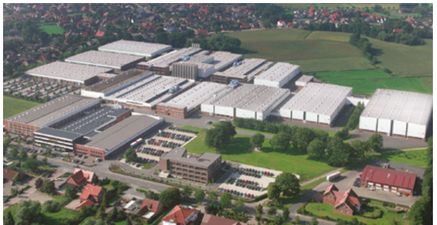
Allemagne, Site 1 : Pöppelmann GmbH & Co.KG, Kunststoffwerk-Werkzeugbau, Lohne