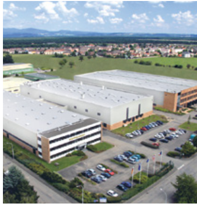
France : Plastiques Pöppelmann France S.A.S., Rixheim

Le département FAMAC® de Pöppelmann développe et produit des pièces techniques fonctionnelles et des emballages pour les secteurs alimentaire, cosmétique, pharmaceutique et médical. Pour ces applications, nous disposons d'un système de management – qualité selon la norme DIN EN ISO 9001 version 2008 ainsi que d'un système de management - hygiène HACCP certifié selon les principes du Codex Alimentarius.