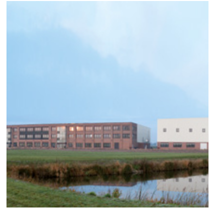
Allemagne, Site 3 (FAMAC®) : Pöppelmann GmbH & Co. KG, Lohne