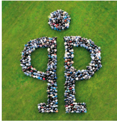
Die „Pöppelmänner und Pöppelfrauen“: Sie stehen für Produktivität, Qualität und Service.

Der Kompetenzbereich Pöppelmann FAMAC® entwickelt und produziert technische Funktionsteile und Verpackungen für die Lebensmittel-, Pharma- und Kosmetikindustrie sowie für die Medizintechnik. Hierfür wurden Einführung und Anwendung eines Qualitätsmanagements gemäß DIN EN ISO 9001:2008 und eines Hygienemanagementsystems HACCP durch ein unabhängiges Institut zertifiziert.