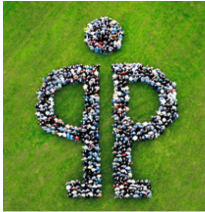
Die „Pöppelmänner und Pöppelfrauen“: Sie stehen für Produktivität, Qualität und Service.

Der Kompetenzbereich Pöppelmann FAMAC® entwickelt und produziert technische Funktionsteile und Verpackungen für die Lebensmittel-, Pharma- und Kosmetikindustrie sowie für die Medizintechnik. Hierfür wurden Einführung und Anwendung eines Qualitätsmanagements gemäß DIN EN ISO 9001:2008 und eines Hygienemanagementsystems HACCP durch ein unabhängiges Institut zertifiziert.