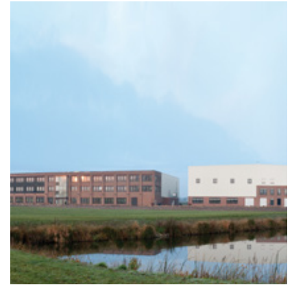
Deutschland, Werk 3 (FAMAC®): Pöppelmann GmbH & Co. KG, Lohne.